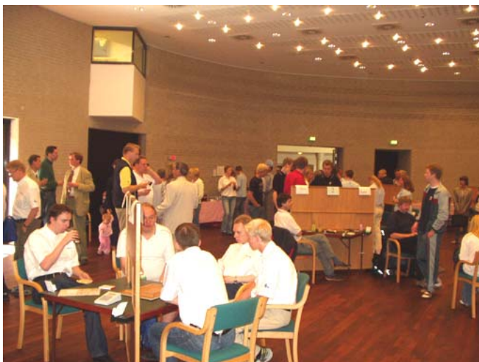
Lige før starten går

Da bulletinstaben har besluttet at afstå fra natteroderi, slutter vores dybsindige vurderinger og analyser her. Dog skal dammen måske til at overveje, om det snart er tiden at æde sine spådomme om de danskes chancer i sig igen.