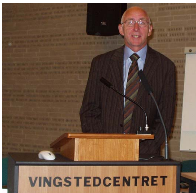
Viceborgmesteren byder velkommen