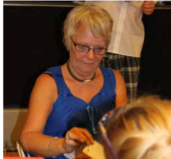
Ingelise meldte og vandt lilleslem