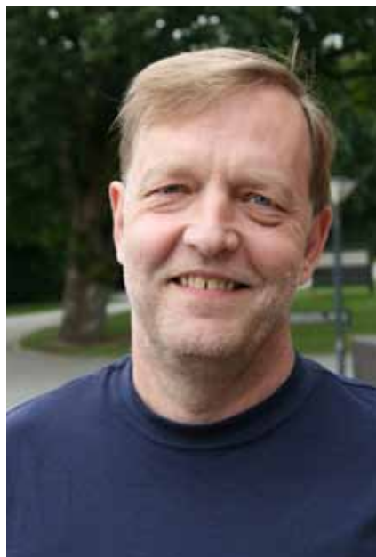
Tom valgte klogt at spille hjerter ud

Spillet bliver faktisk mere interessant med spar ud. Spilfører tester klørene, og når det ikke går, lusker han ♦10 afsted mod bordet. Det er kill point for Vest, som skal huske at dække med damen.