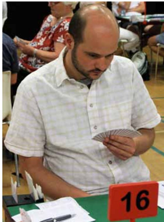
Thomas valgte at afslutte med 7ut

"Drenge og mænd" sluttede lidt under middel i det store felt.