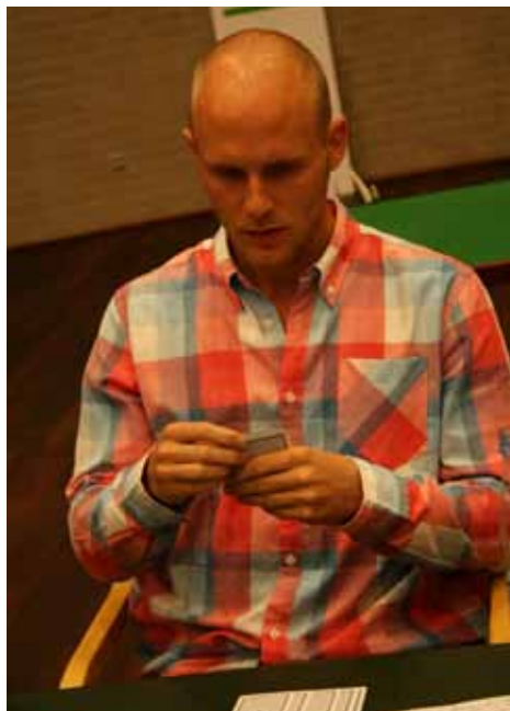
Meldeglade Martin løb tør for RD-skilte

Nu endte meldeforløbet ved 5♦-D, som ikke kan vinde, selvom Ø-V skulle kikse hjertertrumfnin-gen. Der bliver en tredje hjertertaber til sidst. Øst startede dog meget uheldigt med ♥E. De 750, som NS kunne have nappet i 3ut-D, blev således til 750 alligevel.