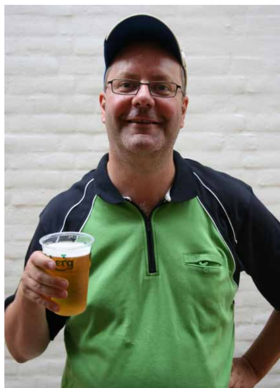
Guldturneringsvinder og så en kold fadøl