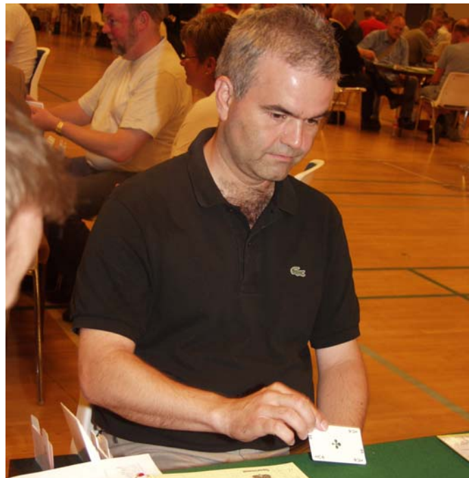
Knut tog ♣E

Vest tog åbningsudspillet på ♥B og sendte ♦E i mar-ken – hvor makkeren bidrog med ♦K(!) som et Lavinthal-kald. Og Øst så fuldstændig rigtigt i, at ♥E og mere hjerter var vejen til en bet.