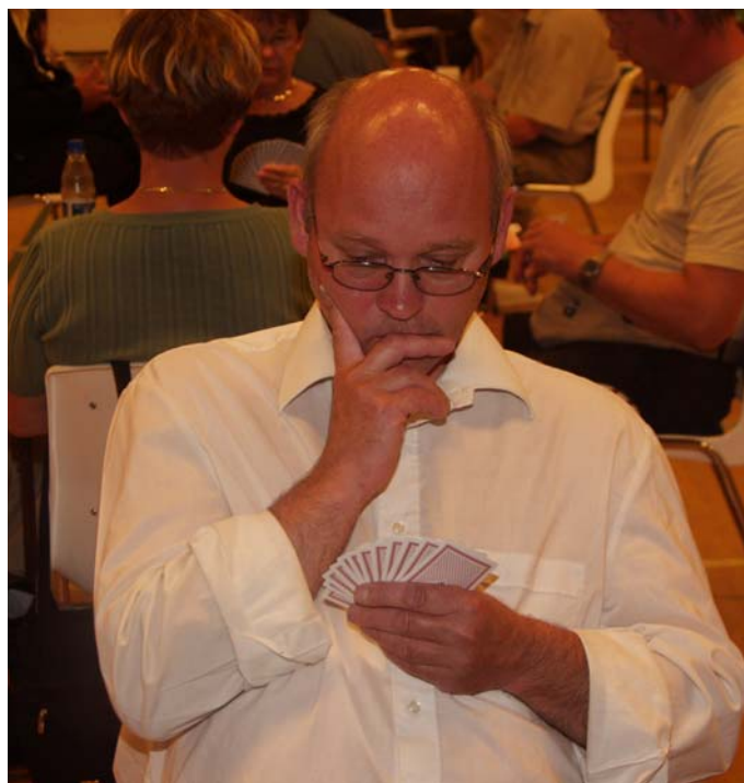
Hansen kan få kredit overalt