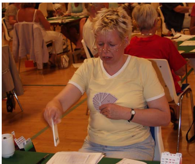
Els: ”We have met nice and not so nice opponents!”