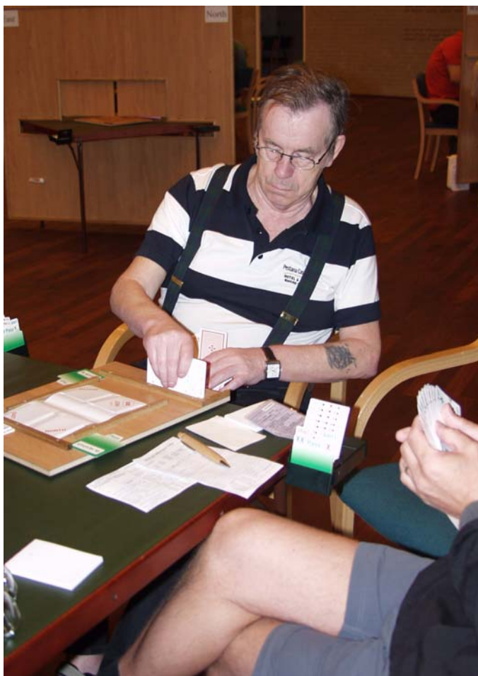
Sveinsson sendte Bridgeministeriet ud i mørket

♣10 gik rundt til damen fulgt af spar til bonden hos Nord, der spillede to gange ruder fra top. Spilfører gik i gang med hjerterne, men Nord trumfede sig ind og trak trumf med bonden, så ofringen kostede 1100.