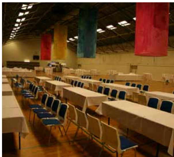
Før og efter ...

Imponerende var det dog, at da morgenen gryede havde morgenfriske folk forvandlet et af festlokalerne til en hal fyldt med alskens bridgemateriel, der kun ventede på at blive brugt i dagens store sideturneringer.