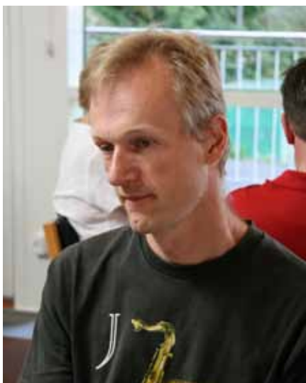
Lauge fandt det dræbende udspil – for modspillet!