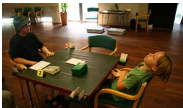
Bridge kan være ret kedeligt uden modstandere

Hvordan den noget barberede turnering ellers sluttede, kan du se andetsteds i denne bulletin.