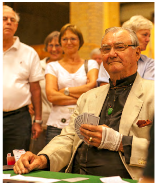
På vej mod en top

Efter doblingen fra Prinsgemalen var ØV uhjælpelig fanget. Udspil ♠E og afvisning med ♠10. Skift til hjerter til EK, spar til kongen, hjerter til trumf, ♠D og modspillet skulle stadig have stik for ♣E og ♦D: tre ned og 800 blev på barometeret belønnet med en delt top: +39 ud af 40 mulige.