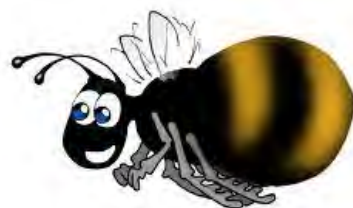
Den kække bi

2♠ blev behørigt dobbelt, men mere end én bet, til -100, kunne det ikke blive til. Mathias' fantasifulde og heldige melding blev belønnet med +24 på barometret.