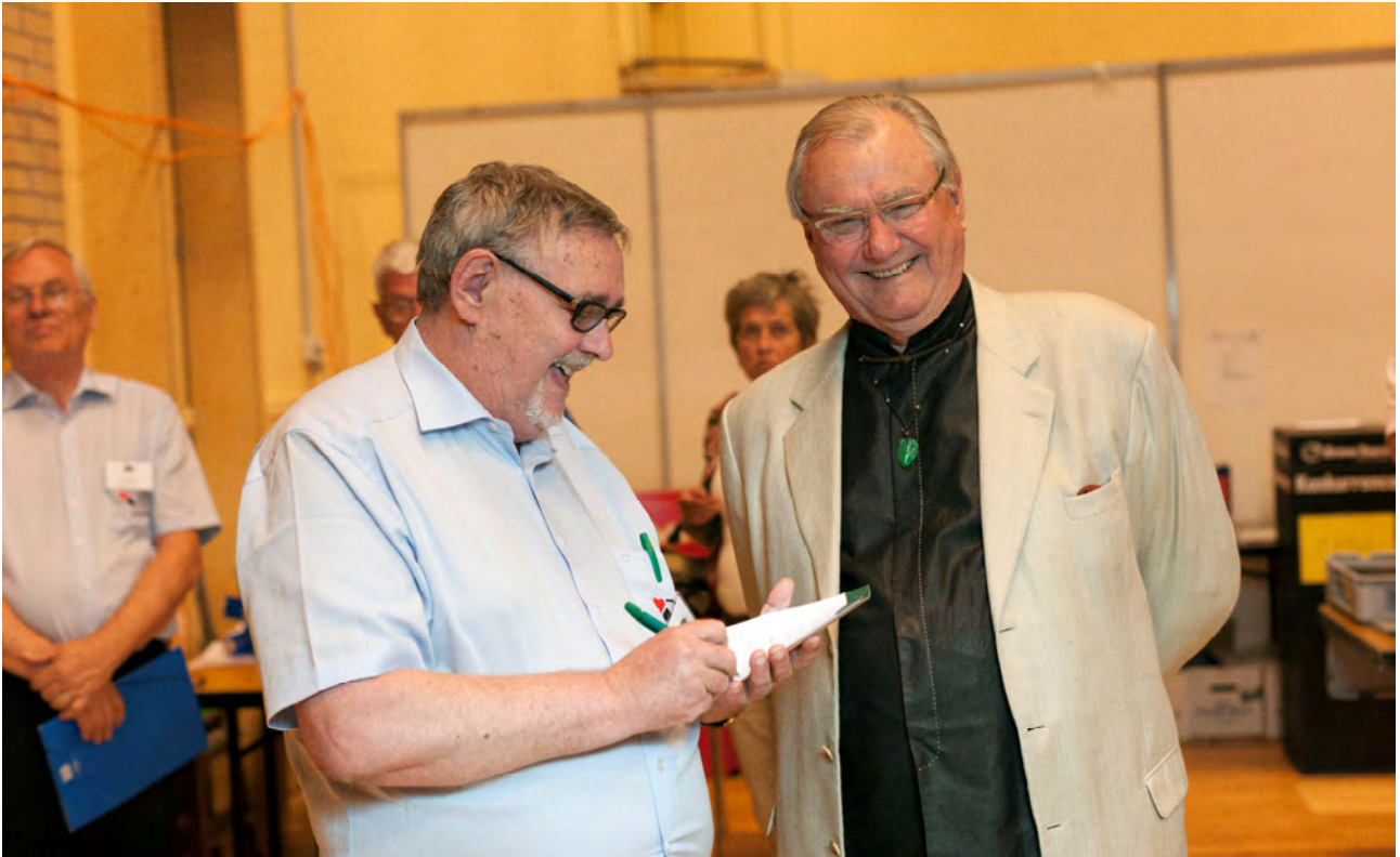
HKH Prinsgemalen og Bulletinens hofmedarbejder

-”Jeg har haft en meget fin dag. En meget dygtig makker og fine forhold omkring bridgen. Det har været en fornøjelse.”