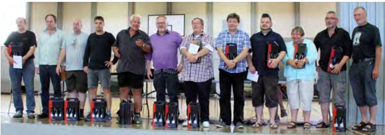
De tre bedst placerede hold i Vinoble Open: 4 fadøl Tak (t.v.), Studene i midten og Old Stars & Young Guns (t. h.)

Hermed slut på en herlig holdturnering, hvor jeg gætter på, at en stor del af deltagerne er friske på en tur til i karussellen igen til næste år.