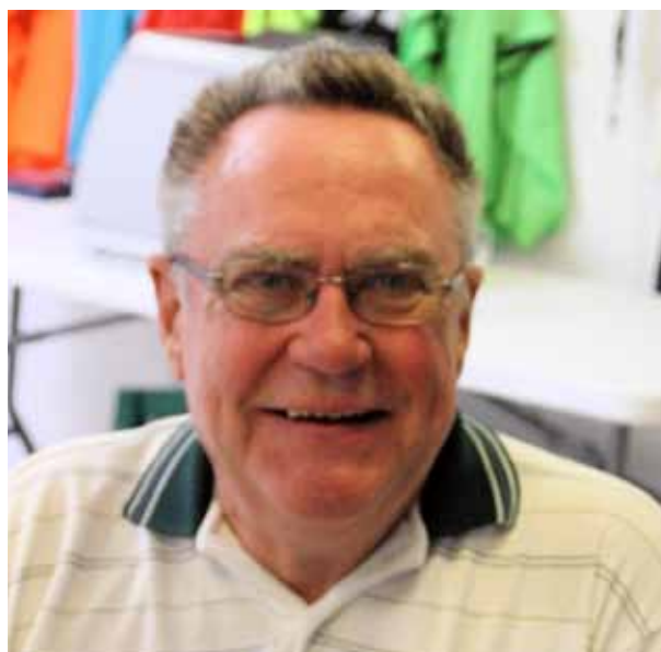
Ole Dam siger pænt undskyld til alle damerne