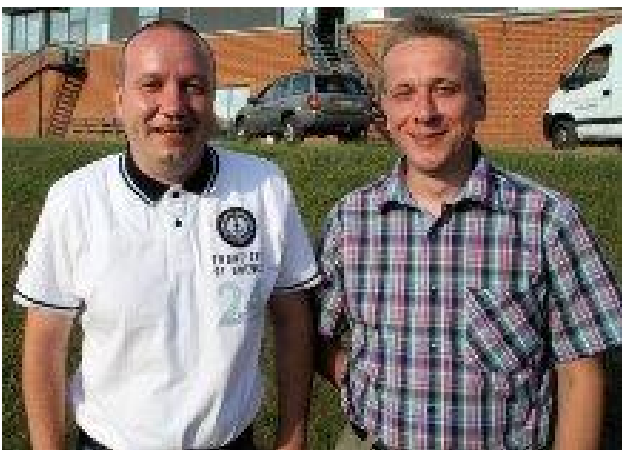
Sherifferne, der skyder efter det hele.

Næh, svaret er ganske simpelt et andet: De vil være Danmarksmestre, så de spiller med i DM-Åben. Det er selvfølgelig ikke 100% sikkert at de vinder DM, men I kan roligt regne med, at de forsøger.